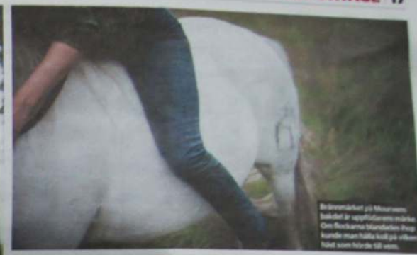
Beluguemärket på Mourven. Bilden är uppfödarens märke. Om flockarna Mandarins Flop kunde man hitta två på vilken höjd som helst till vem.